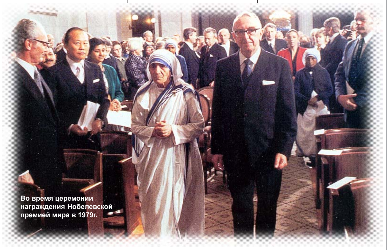
Во время церемонии награждения Нобелевской премией мира в 1979г.

5 сентября 1997 г. – смерть матери Терезы в Калькутте от инфаркта.