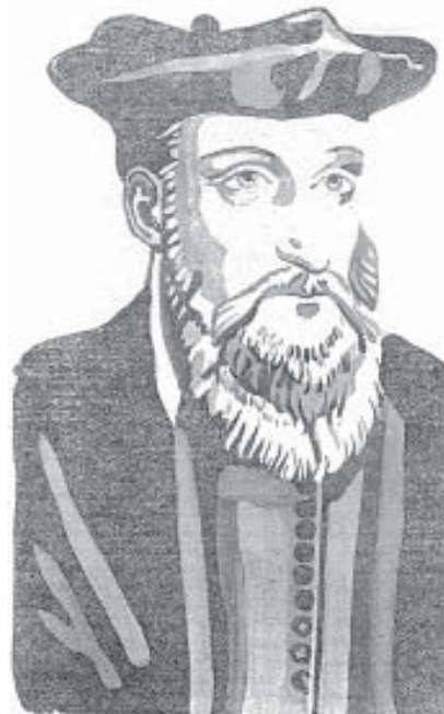
Мишель Нострадамус (1503—1566)

Трудно народу от этого гама, Который устроила древняя Дама,