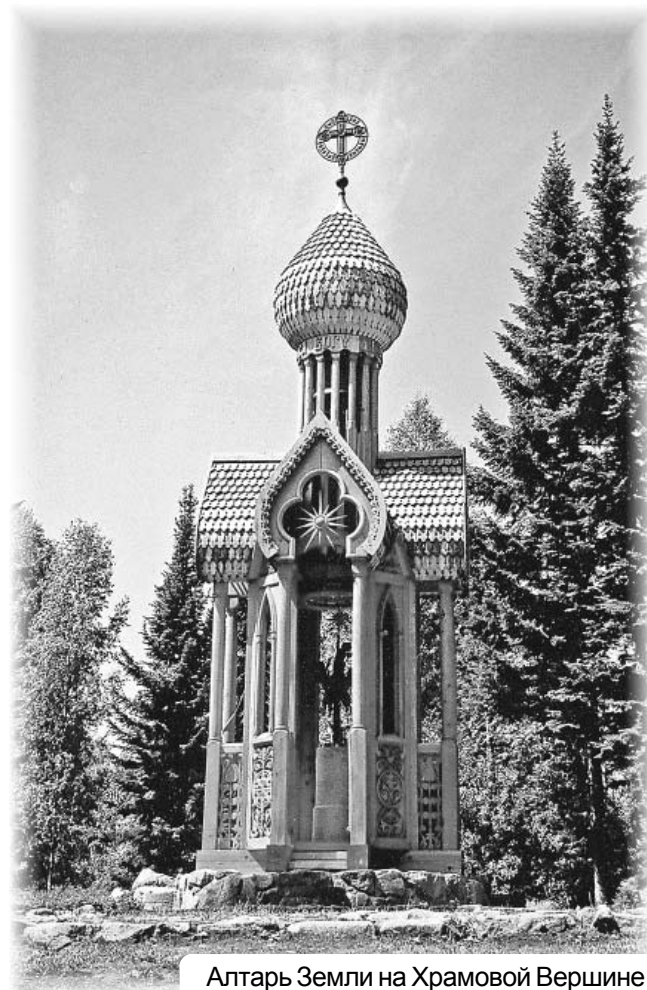
Алтарь Земли на Храмовой Вершине

Благодарю, Учитель мой, за утро доброе, святое, За каждый миг, что Ты со мной Лишь стоит вспомнить образ Твой, Твоё лицо родное. За мир в душе, что даришь мне. С ним всё вокруг, как в сказке, За кров над головой в моей судьбе, За мужа, за любовь его и ласку. Сейчас я только поняла, Что это дорого мне стало. Я столько лет, Христос, спала, Ты разбудил меня, я встала. Спасибо за детей моих родных, За внуков милых и далёких. Я знаю, это всё коснётся их, Они услышат шаг Твой лёгкий. Спасибо за дневную суету, Она дорожке сердцу стала. Друзей четвероногих доброту, Их преданность порою удивляла. Ты Силу и Любовь раздариваешь нам, Лишь свой сосуд открыть навстречу надо. И всё по силам будет нам, Лишь верить всем нам безоглядно надо.