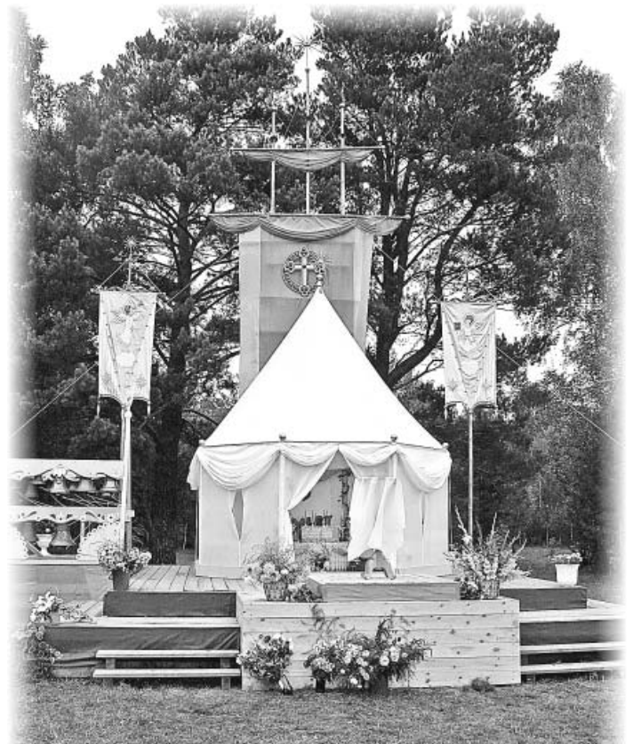
Скиния на Острове Праздничном