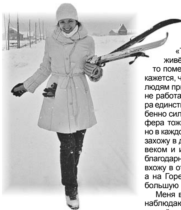
Зимняя прогулка в Тюхтятах

Когда я только пришла в театр, меня стали «обучать петь». С раннего детства я пела с мамой, пела потому что «пела» моя душа, пела моя мама. Пела я всегда и везде. Надо мной даже подшучивали: «Есть хотя бы минута, когда ты не поёшь?»